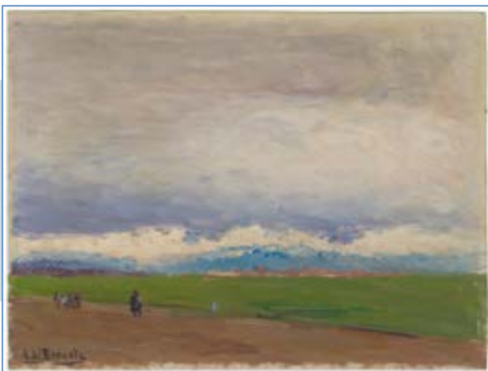
Paisaje de Castilla, Aureliano de Beruete. Hacia 1907

Se emitirán certificados para los participantes exclusivamente cuando esté confirmada una asistencia de un mínimo del 80 % del seminario.