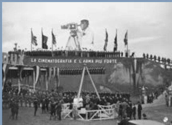
Ceremonia de apertura de Cinecittà. Roma, julio de 1936