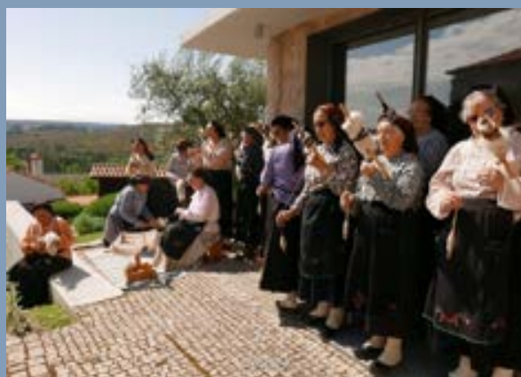
Red Tramontana III, 2018.