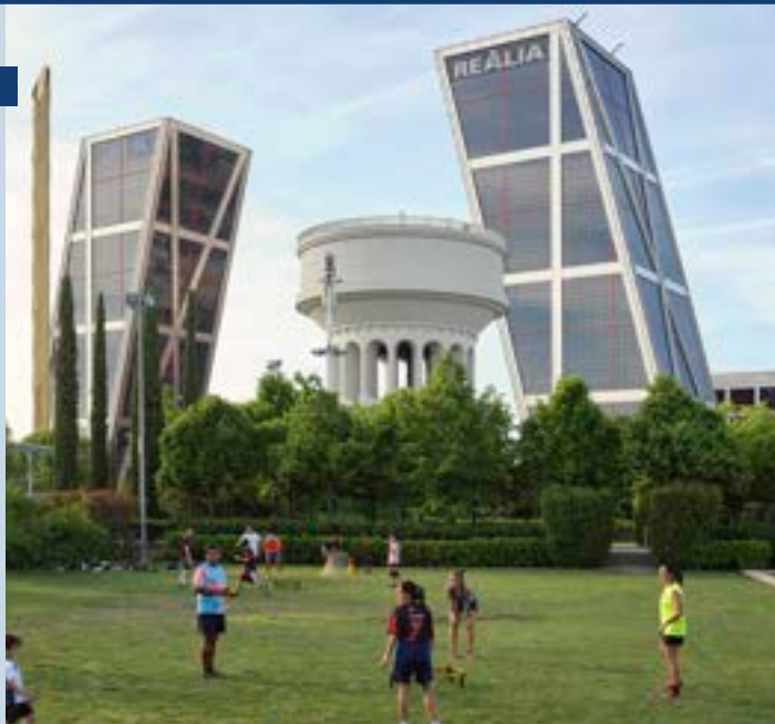
Distrito Chamartín. Juego Roundnet. Parque del cuarto depósito. Fotografía: Fernando Maquieira para Misión Región, 2022